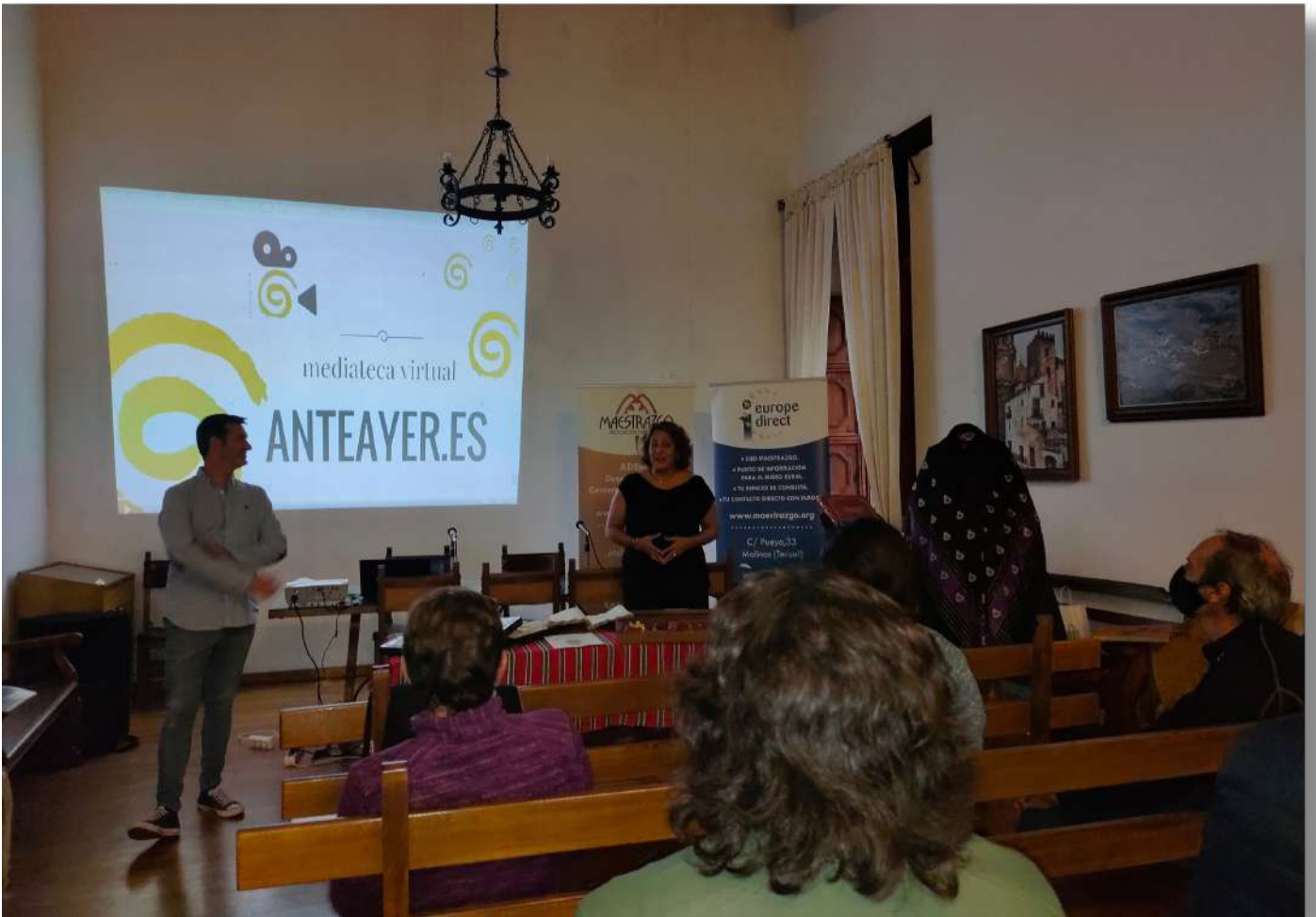
Fotografías de Adema